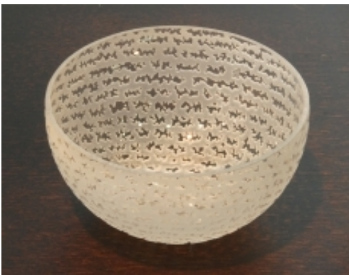
「Kai」 雨宮 直子 (大学院美術研究科工芸専攻1年) H40×Φ65mm ガラス、ホットワーク、サンドブラスト