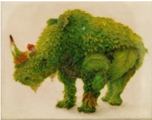
「共存」 前田 恭兵 (美術学部工芸科4年) H270×W220×D20mm 有線七宝