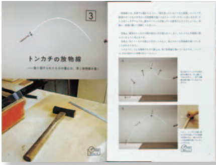
企画・制作 ベネッセ教育研究開発センター、慶應義塾大学佐藤雅彦研究室 編集・執筆 佐藤雅彦+ユーフラテス 『日常にひそむ数理曲線 DVD-Book』(小学館刊)

理由で、数学を遠ざけていたりします。そこで、数学が持っている深さや身近さを、実験室などの特殊な状況ではなく、日常という普通の状況の中で、しかも目が離せなくなるくらいの映像で見せることができないか、と長い間考えていました。漠然と過ごしている日常は、きれいな「理」で動いています。それを難しい理屈ではなく、誰でもハッとするような映像にできないものか。それに対する私なりの答えが、『日常にひそむ数理曲線』といえるかもしれません。例えば、「クロソイド曲線」という言葉は聞いたことがな