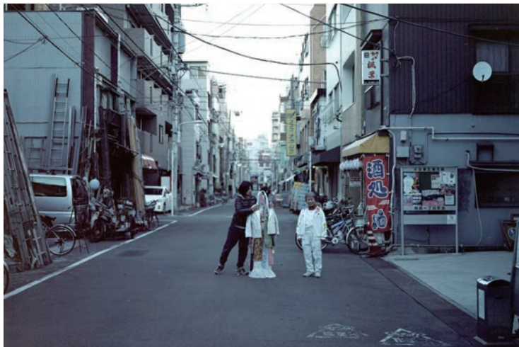
伊藤 久也 「被服を巡るドレミファ」 ミクストメディア、映像