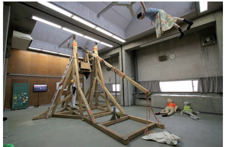
中野 岳 「空飛ぶワイフ」 投石機型のオブジェ、インスタレーション