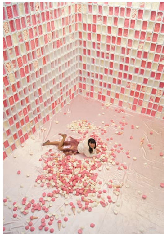
三木 みどり 「ラッキーアイスクリーム」 紙粘土、アイスボックス