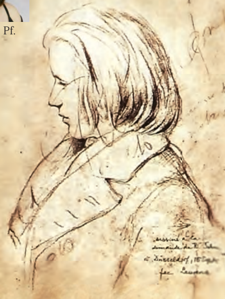
R.シューマンがJ.J.B.ローレンスに描かせた20歳のブラームス