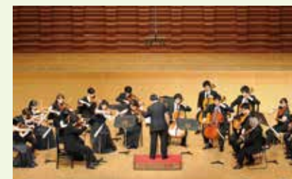
2014.7.12 弦楽シリーズ R.シュトラウスの弦の響き