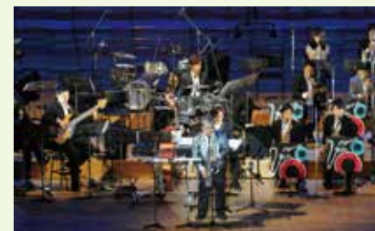
2014.7.24 ジャズin 藝大 藝大から巣立ったジャズメン Part2