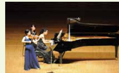
2014.5.25 & 6.1, 10, 13 & 19 ピアノシリーズ ベートーヴェンのソナタ