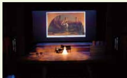
2014.6.7 第2回「目で見ると読むシェイクスピア、音で読む『ハムレット』」