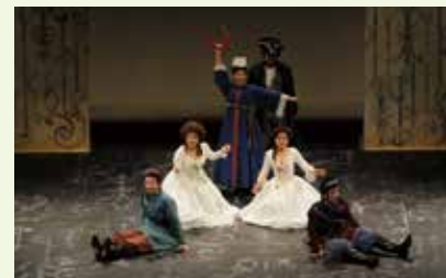
2014.10.4-5 オペラ定期 モーツァルト「コシ・ファン・トゥッテ」