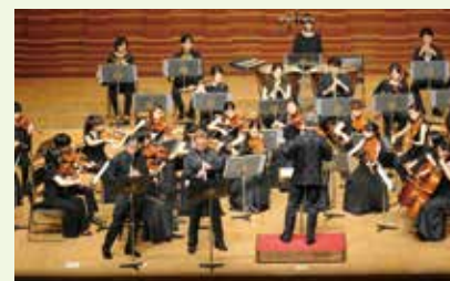
2014.7.11 管弦楽シリーズ 日独名手の管演