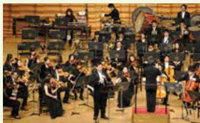
2014.4.25 創造の社 伊伊藤オーケストラコンサート