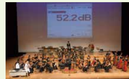
2014.7.5 藝大とあそぼう オーケストラへの招待