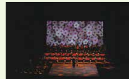
2014.10.8 和楽の美 義経一静と義経の物語