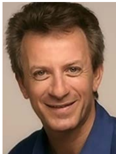
ロラン・ドガレイユ ヴァイオリン Roland DAUGAREIL Violin

Y.メニューイン、S.ヴェーグラに学び、ヴァイオリンと室内楽で1等賞を得てパリ国立高等音楽院を卒業。ストレーザ、ロンドンなどの国際コンクール第1位。22歳でパリ・オペラ座管弦楽団コンサートマスター。現在パリ管弦楽団コンサートマスター。サルトリ弦楽トリオなどで室内楽活動。パリ国立高等音楽院とパリ地方音楽院教授。仏政府よりシュヴァリエ勲章受章。1708年製のストラディヴァリウス“Txinka”を使用。東京藝術大学音楽学部卓越教授。