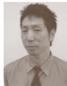
召使いポリカルプ 重盛次郎