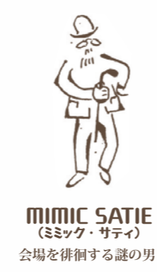
MIMIC SATIE (ミミック・サティ) 会場を徘徊する謎の男?