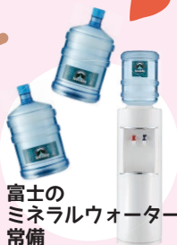
富士の ミネラルウォーター 常備