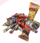
うまい棒食べ放題