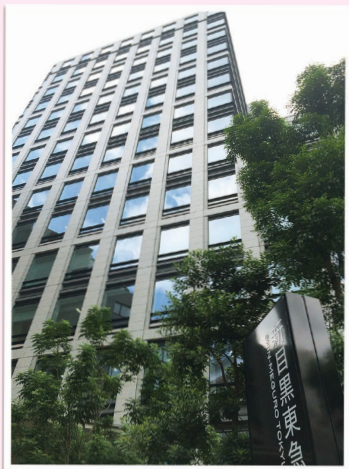
スターバックスと同じ本社

我が社は保守・運営・開発を行っている社員数約 200 人の IT 企業です 大手お客様先でプロジェクトに参加したり、自社で開発を行っています 男性はもちろん、女性のエンジニアも多く活躍しています しっかり研修制度が整い、必ず活躍できる IT エンジニアになれます