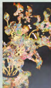
ベトナム美術大学