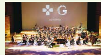
2017.3.29 奏楽堂企画学内公募 藝大ゲームサウンドオーケストラ