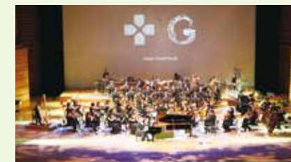
2017.3.29 奏楽堂企画学内公募 藝大ゲームサウンドオーケストラ