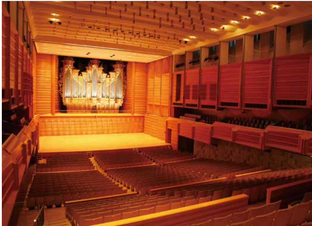
東京藝術大学奏楽堂