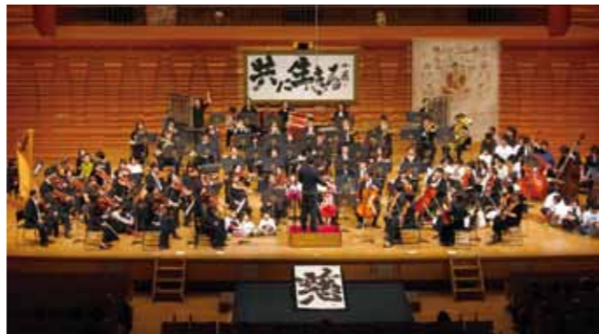
昨年度のコンサートより「見える音 ~オーケストラの中に入ろう!~」