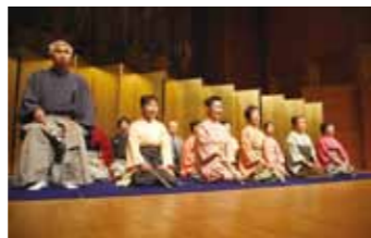
昨年度のコンサートより「能の心 ~障がいを越えて~」