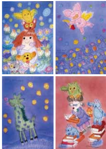
エム ナマエの作品