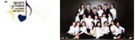
HEARTS of VISION CHAMBER ORCHESTRA

Concert HEARTS of VISION CHAMBER ORCHESTRA コンサート ~韓国の視覚障がい者によるオーケストラ~ 16:15開演