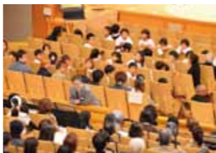
昨年度のコンサートより 展示作品を見ながらお客様に語りかける 本学宮田亮平学長