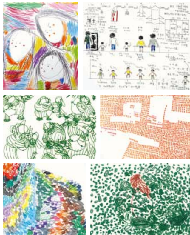
社会福祉法人愛成会 アトリエばんげあの作品