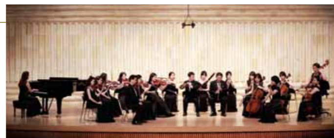
HEARTS of VISION CHAMBER ORCHESTRA

J.シュトラウスII世 オペレッタ《こもり》より〈序曲〉 B.バルトーク 《ルーマニア民俗舞曲》 E.ワルトイフェル 《スケーターズ・ワルツ》 A.シルヴェストリ 映画「フォレスト・ガンプ 一期一会」より《メイン・テーマ》 J.ボック ミュージカル「屋根の上のヴァイオリン弾き」より《サンライズ・サンセット》 韓国民謡《アヒラン》ほか