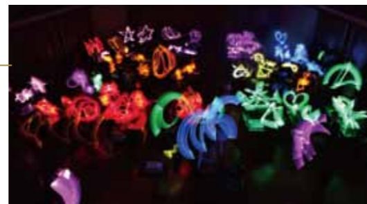
昨年度のワークショップの様子

ビーズやプラ板、アクリル板を使って家をつくりましょう。 筑波大学附属大塚特別支援学校の生徒と藝大生の共同 制作作品を、一般の方々も参加して完成させます。