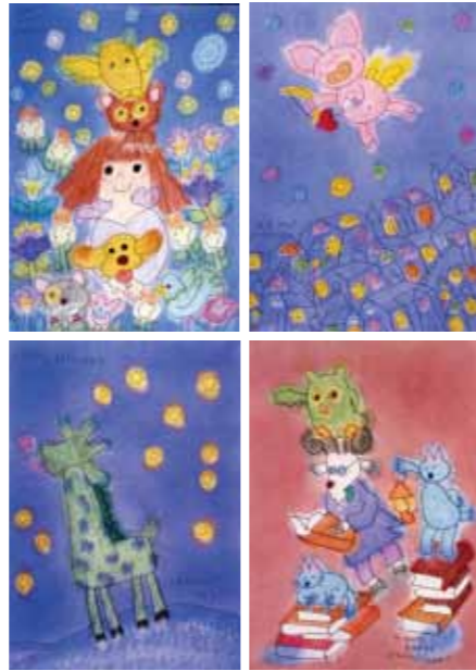
エム ナマエの作品