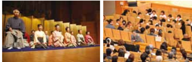
昨年度のコンサートより「能の心 ～障がいを越えて～」