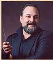
指揮 ステファノ・ マストランジェロ