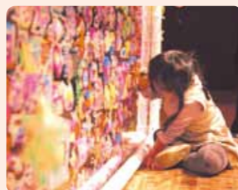
昨年度ワークショップの様子