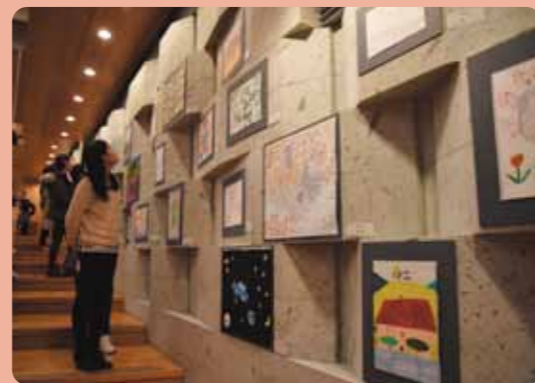
写真:昨年度の「藝大アーツ・スペシャル」の様子 表紙作品:Yuki FUJIOKA