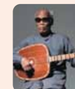
チャパイ: ダンヴェン・コン・ナイ