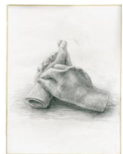
平成25年度 合格者答案 手首2個