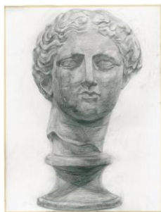
平成23年度 合格者答案 《パルテノン・ヴィーナス(ラポルト)》