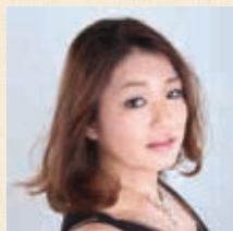
野間 愛 (メゾソプラノ) Ai NOMA (Mez)