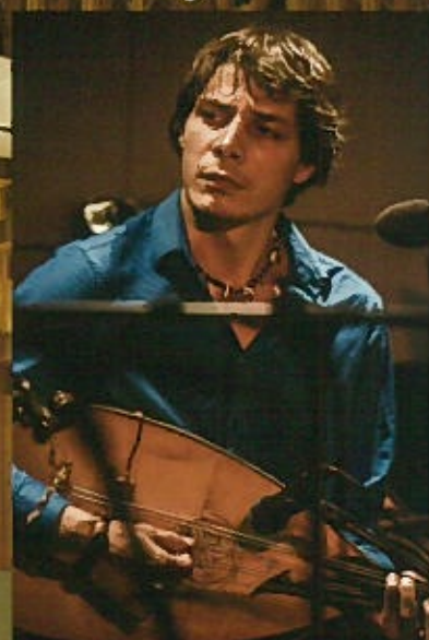
ラーズロー・スラマ