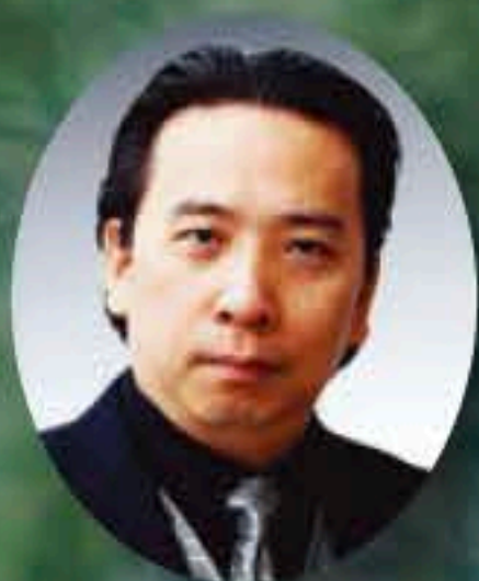
バリトン 甲斐 栄次郎