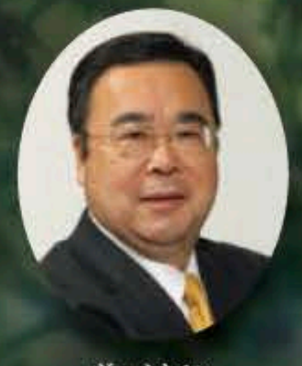
ヴァイオリン 澤 和樹