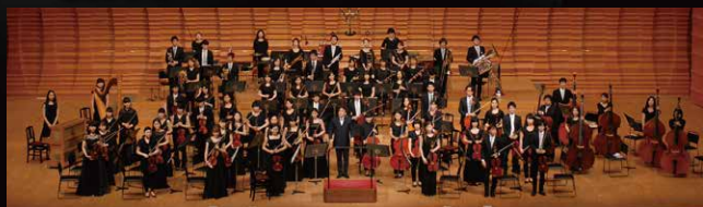
東京藝大シンフォニーオーケストラ