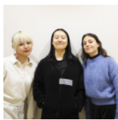
東京藝術大学 美術学部 先端芸術表現科3年 からす

引田のひなまつりは、飾られなくなった人形を再び飾ろうとした決意から始まったそうです。人形に宿る記憶と時間を手がかりに、「はじめる」「おわらせる」という静かな意思の在り処を、小さなお芝居を通して探ります。