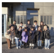
香川大学 創造工学部 造形・メディアデザインコース 有志学生