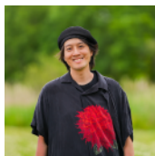
東京藝術大学大学院 美術研究科 先端芸術表現科専攻 修士課程 2 年

AI の分類で用いられるバウンディングボックスを立体化し、引田で集めた言葉を重ねた。確率やラベルが覆い隠してしまう身体や記憶は、分類の外側で静かに存在し続けている。AI に入力されていない情報は、いつから「なかったこと」になるのだろうか。